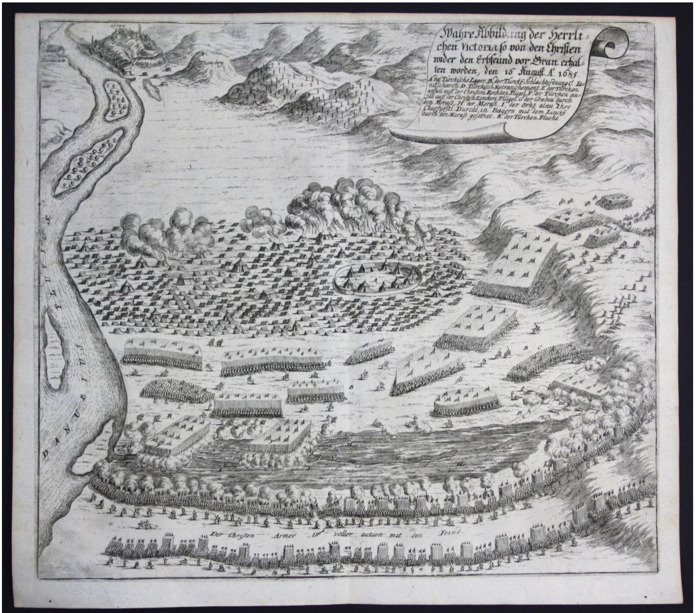
XVII-wieczna rycina przedstawiająca odsiecz twierdzy Ostrzyhom w dniu 16. sierpnia 1685 roku, sporządzona na podstawie współczesnych przekazów kartograficznych bezpośrednio z pola bitwy.