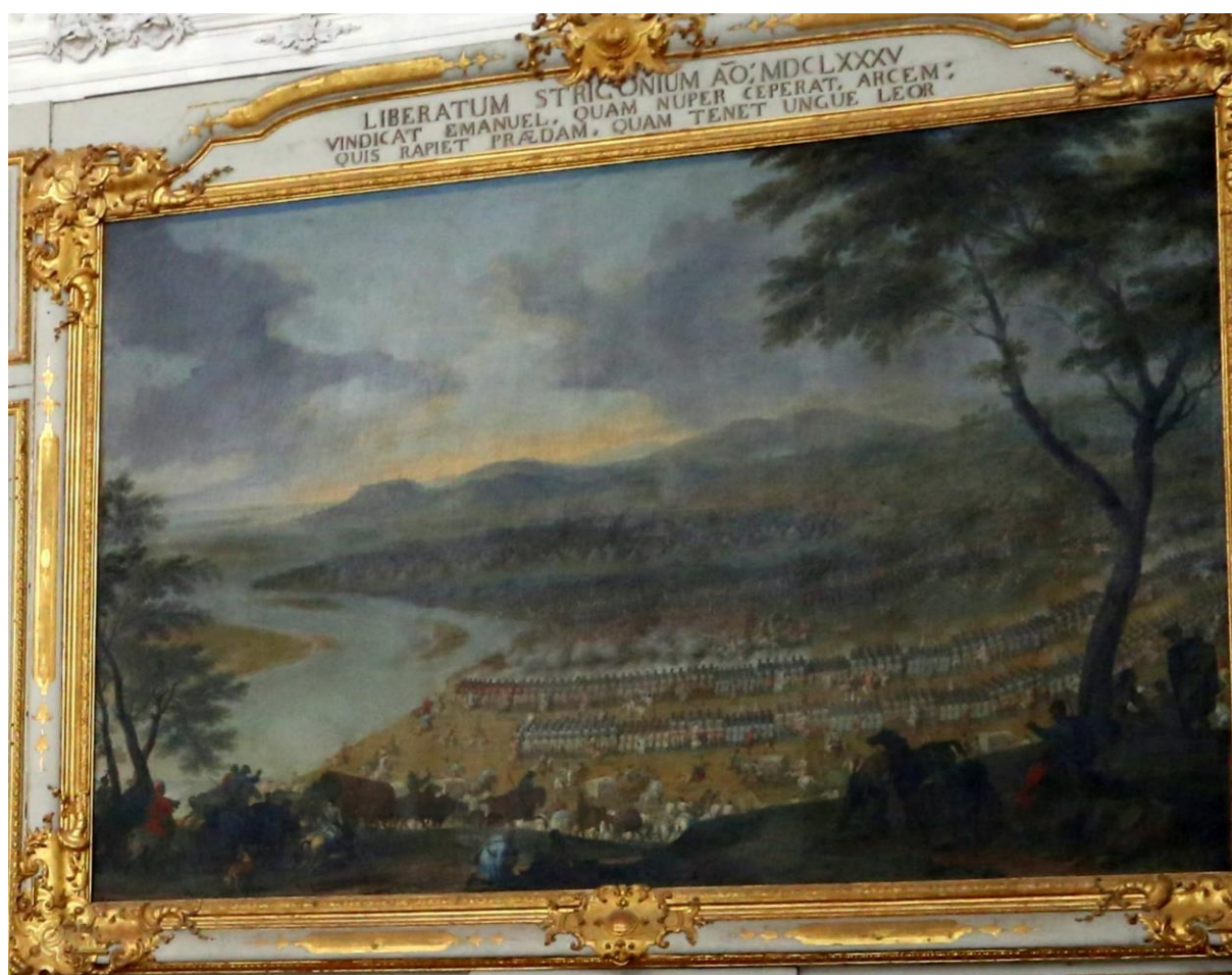
„Odsiecz twierdzy Ostrzyhom w dniu 16. sierpnia 1685 roku”, Sala Viktorii w zamku Schleißheim.

Link do obrazu: https://www.sammlung.pinakothek.de/de/artist/franz-joachim-beich/entsatz-der-festung-gran-im-jahr-1685