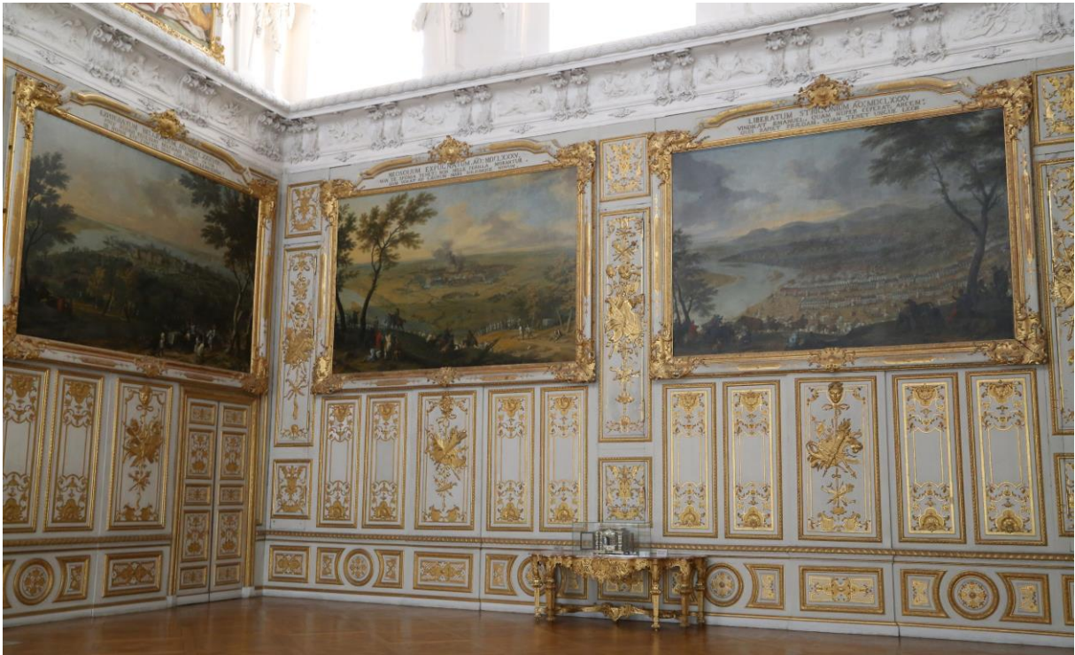
„Odsiecz twierdzy Ostrzyhom w dniu 16. sierpnia 1685 roku”, widok na Salę Viktorii w zamku Schleißheim.